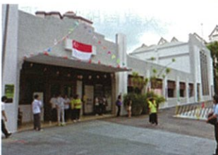
昭南福特車廠紀念館