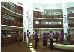
萊佛士書院的圖書館