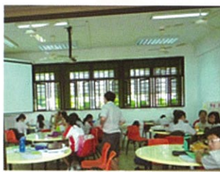
國家初級學院的教室

另外，新加坡中小學每日舉行朝會升旗儀式，由校長帶領全校師生，進行國民誓詞的宣讀，潛移默化地引導學生，顯現老師與學生對國家、學校及家庭之認同。這次造訪新加坡，也很幸運地遇上了他們的國慶典禮預演，新加坡也要求全國的小學生都要分批參加國慶典禮的預演以及正式演出，以培養對國家的認同及愛國情操。