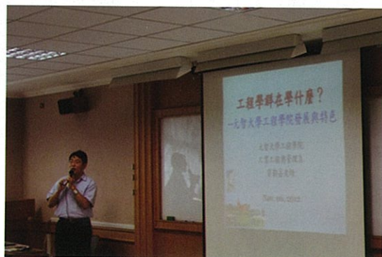
梁教授與本校校友 介紹工程學群