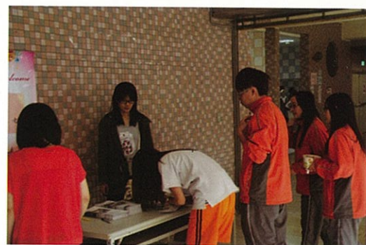
王教授介紹大眾 傳播各系所特色