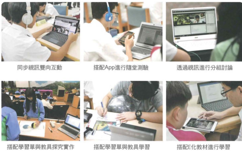
同步視訊雙向互動

本校於106年加入 臺北市網路學校創始團隊 ，與大學端合開多元課程，南湖「 跨越時空星鮮人 」課程頗獲好評，運用學校遠端遙控天文台技術，提供實作式的學習體驗，也透過網路分享課程給友校。