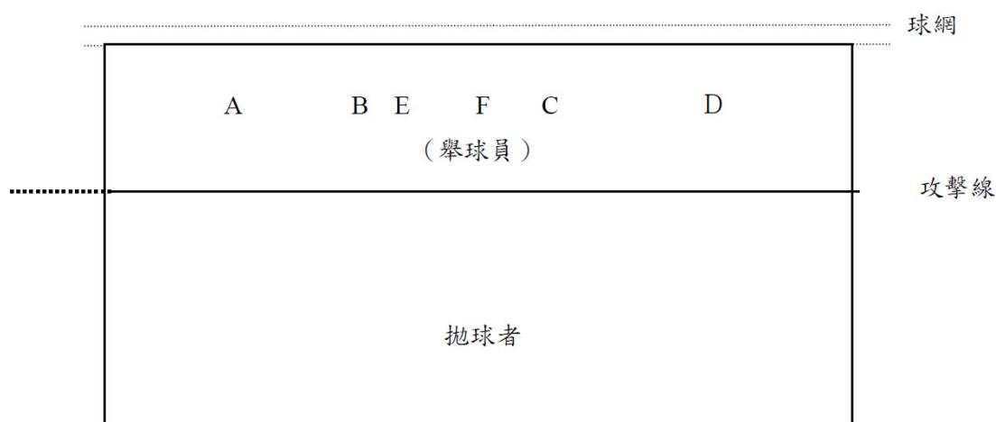
圖二 排球攻擊手快攻位置示意圖