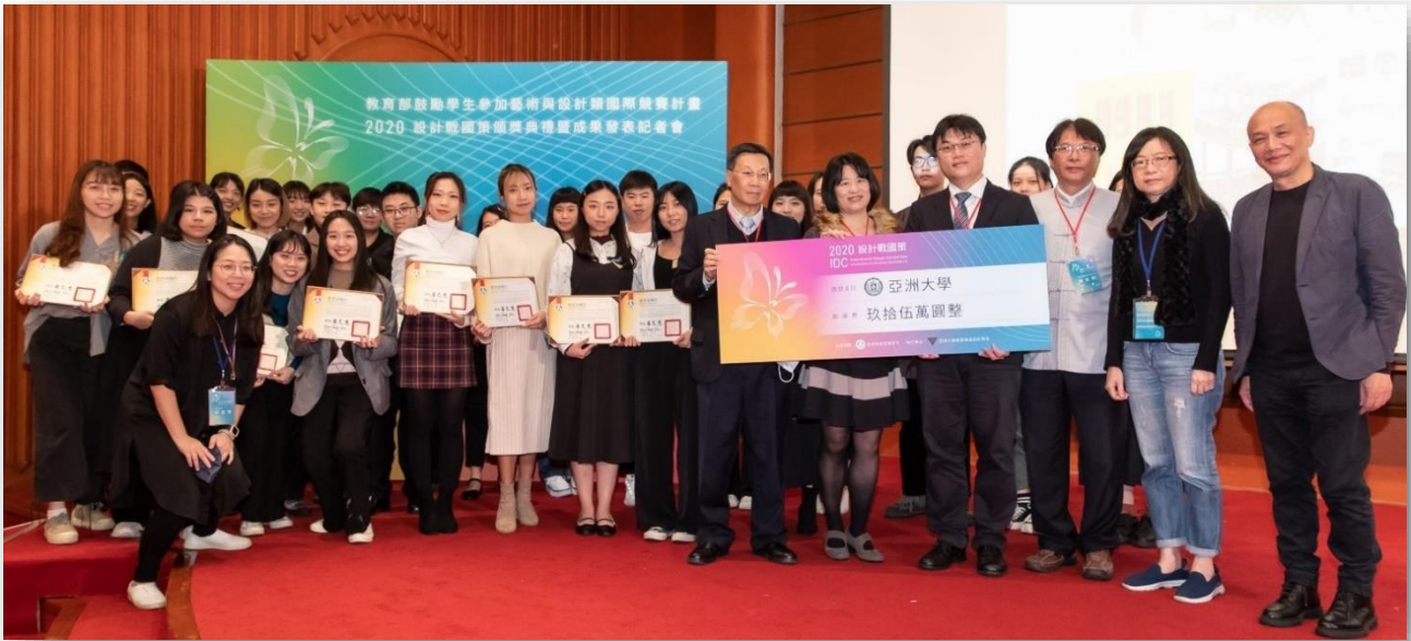
圖：亞洲大學獲國際設計競賽 7 年高教第一！

校址：台中市霧峰區柳豐路 500 號 招生諮詢專線：04-23323456#3132~3135 網址： https://rd.asia.edu.tw