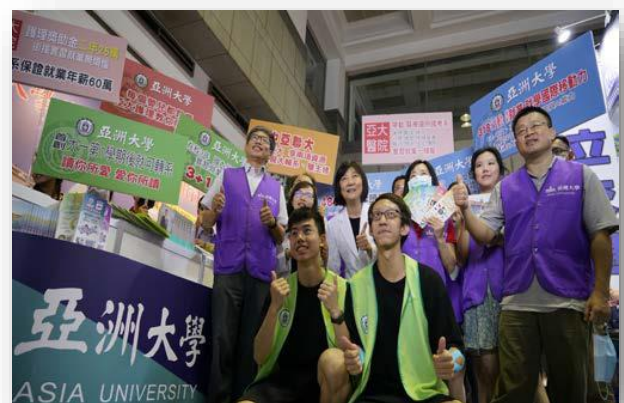
圖：招生處行政團隊參加大學博覽會