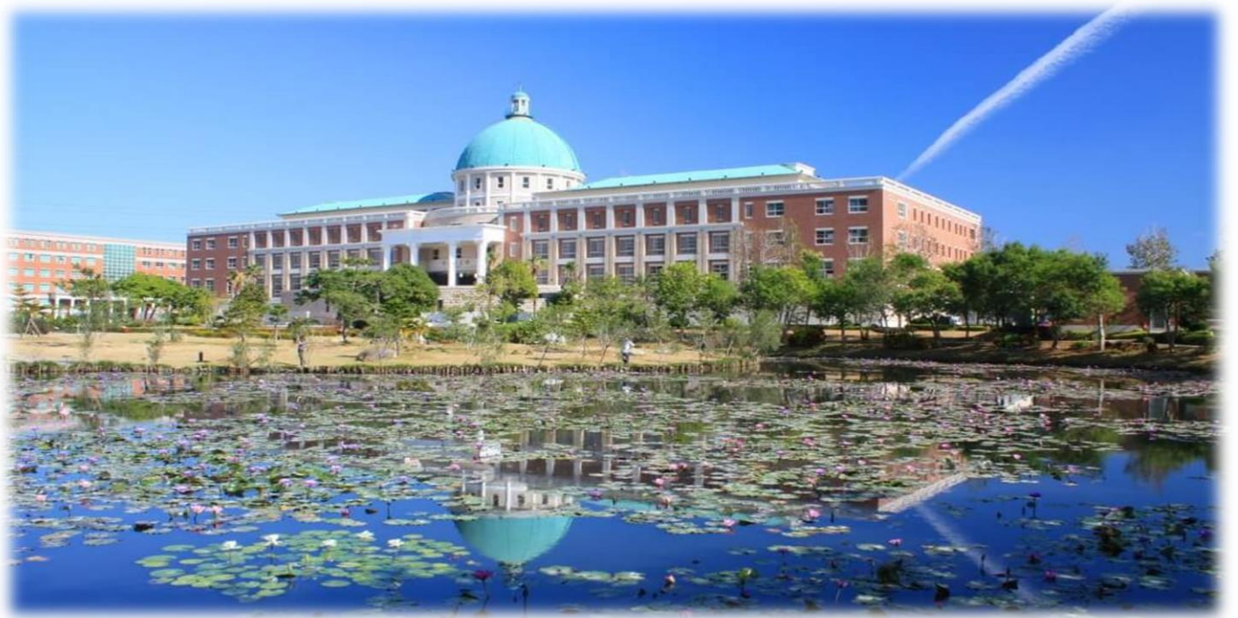
圖：就讀亞大，宛如就讀一所「綜合大學」+「醫學大學」+「國際大學」