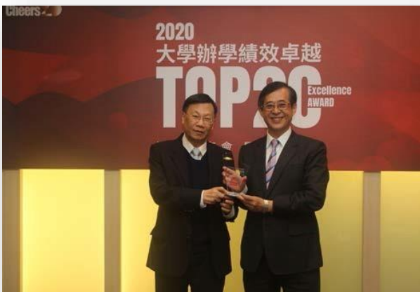
圖：大學辦學績效 TOP20，全台第 9 名！