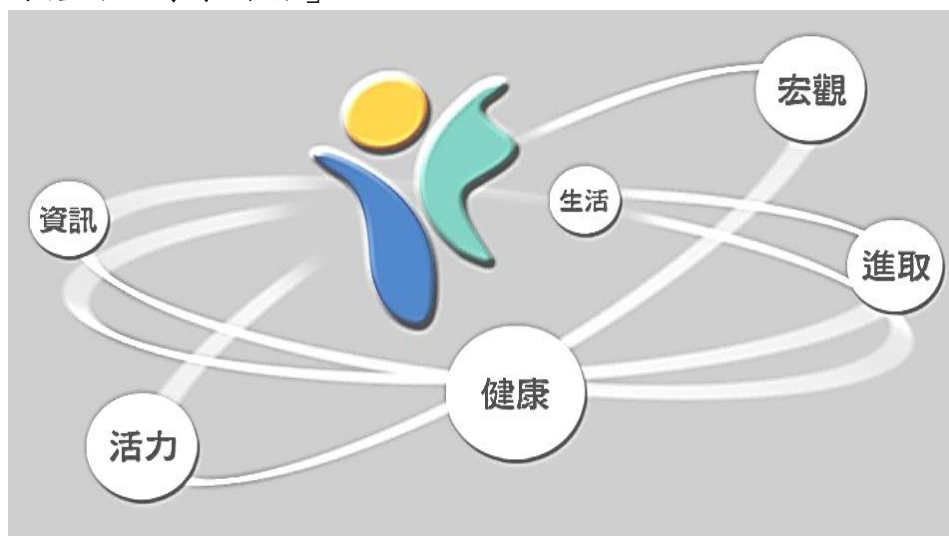
圖 1：學校願景示意圖

因此，本校課程以學校願景、校本課程核心理念與十二年國教核心素養為基礎，發展課程，編撰、研發與整合教材，並進行學習共同體、U 化學習、多元評量，以適應未來社會生活為導向，發展終身學習、協調溝通、瞭解人我、宏觀進取、身心健康的全人教育為目標，希望在教學上協助南湖學子都能「學業有橙」，在生活上薰陶南湖學子成為「校容可橘」有禮貌的下一代，期使南湖學子透過主動學習，成為「樂於服務、善於合作、視野前瞻的終身學習者」。