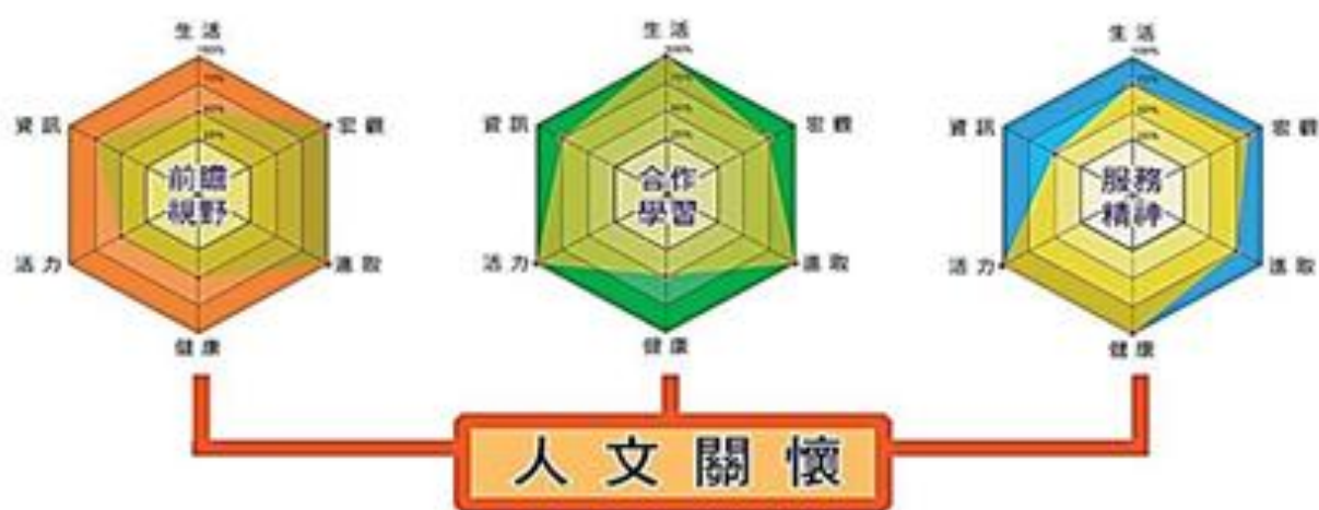
圖 2：本校發展目標與願景關係圖

105 學年度學校凝聚共識，建構南湖學生圖像為「樂於服務、善於合作、視野前瞻的終身學習者」，希冀三年的高中生涯能培育每一個南湖之子兼具五大關鍵能力：人文關懷力、解決問題力、思考表達力、創新實作力、國際視野力。