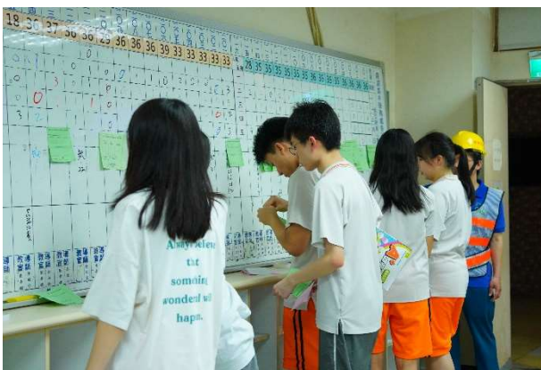
綠紅單清點人數並回報校安中心(2)