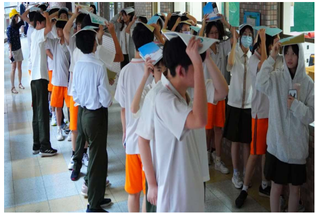
疏散至走廊並清點人數(1)