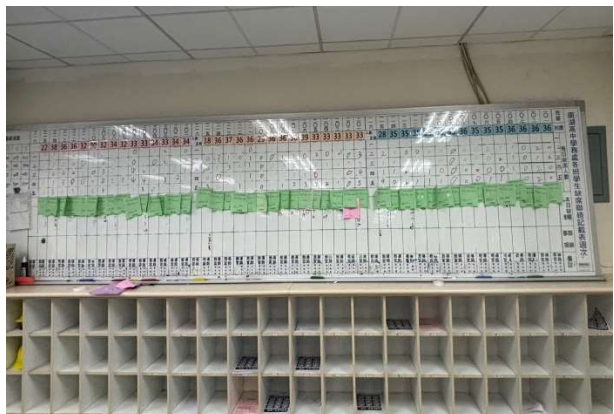
綠紅單清點人數並回報校安中心(3)