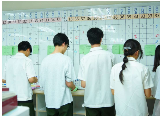
綠紅單清點人數並回報校安中心(1)