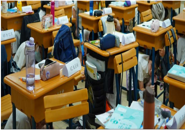
聽到地震警鈴立即趴掩護(3)