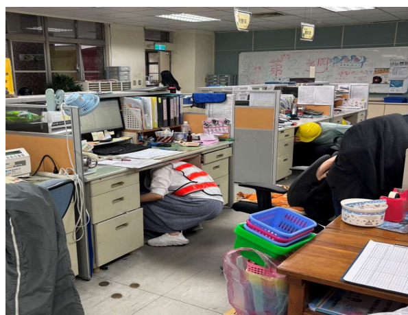
聽到地震警鈴立即趴掩護(1)