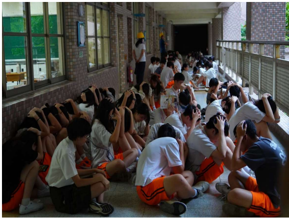
疏散至走廊並清點人數(2)