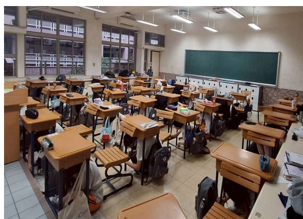
聽到地震警鈴立即趴掩護(2)