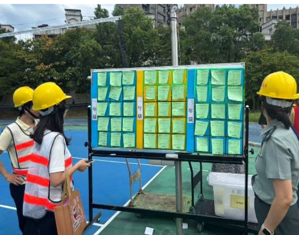
綠紅單回報校安中心