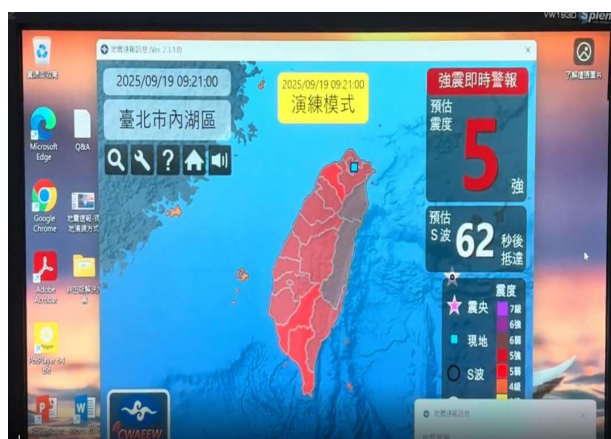
強震即時速報系統