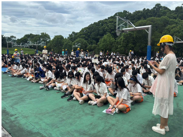
疏散至操場並清點人數