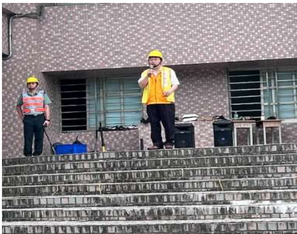
指揮中心管控現場狀況