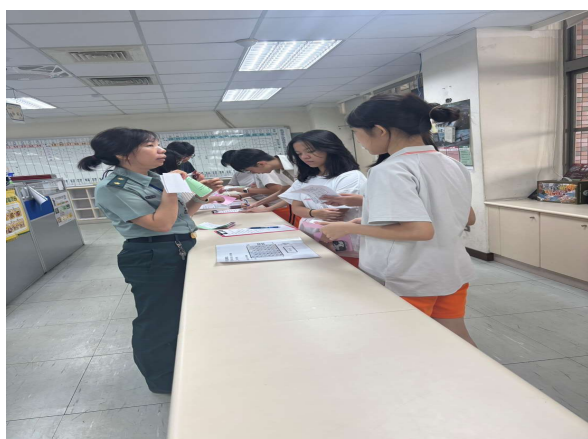
幹部宣導：綠紅單使用方法與疏散位置