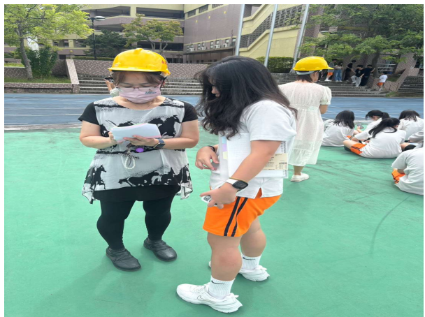
使用綠紅單清點人數