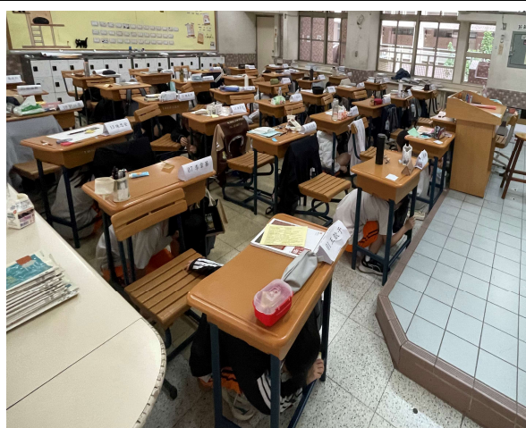
聽到地震警鈴立即趴掩護(1)