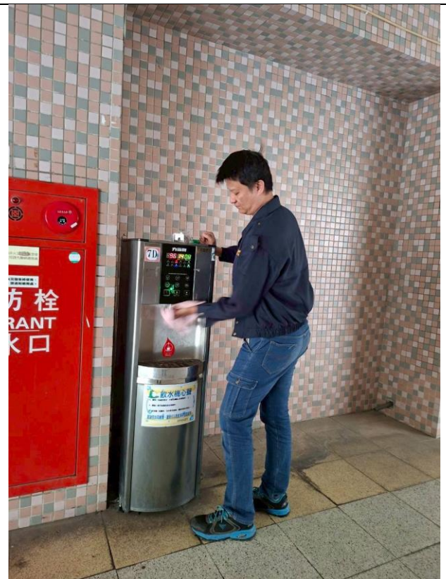
7 D : 中柱樓 7 樓