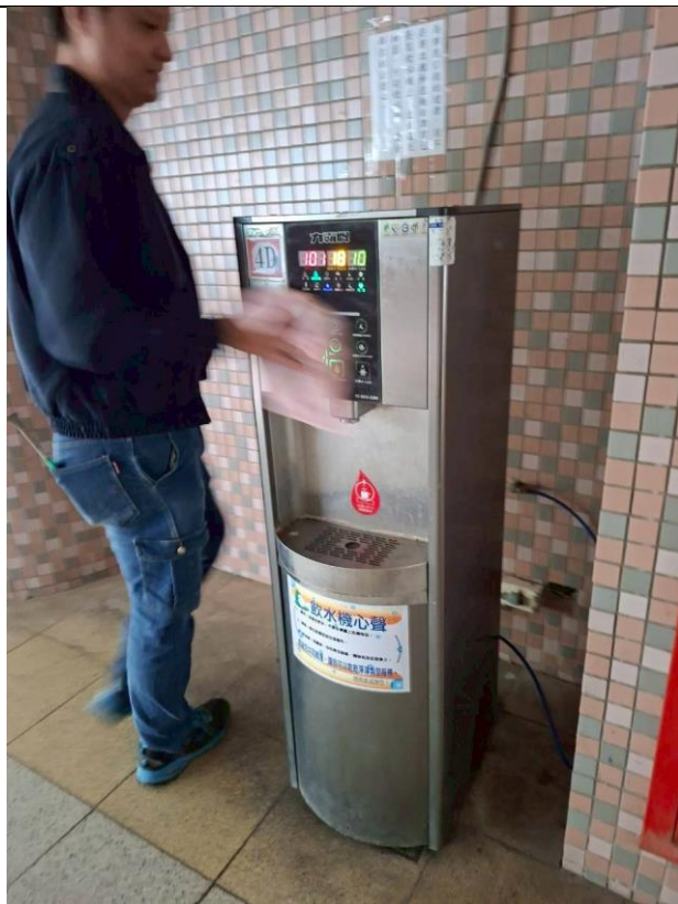
4 D : 中柱樓 4 樓