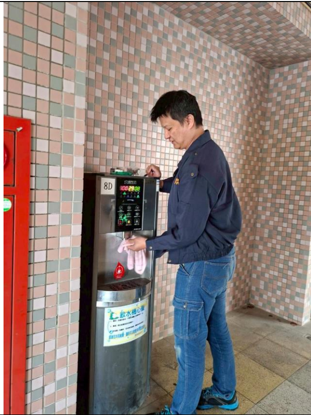
8 D : 中柱樓 8 樓