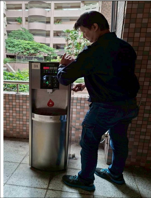
3 A：東風樓南側 3 樓