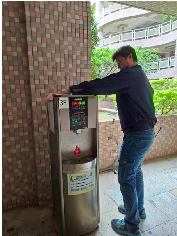
3 E : 中道樓 3 樓