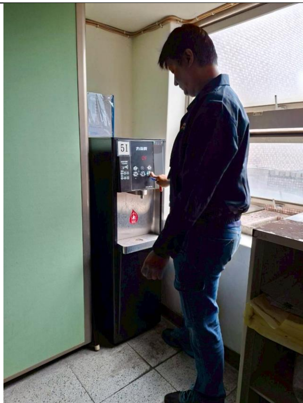
5 I : 5 樓體育辦公室