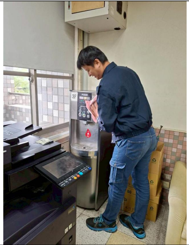
3 F：3 樓教師辦公室