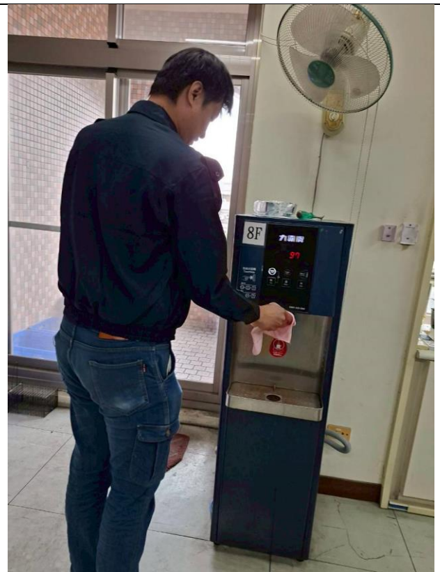
8 F：8 樓導師室