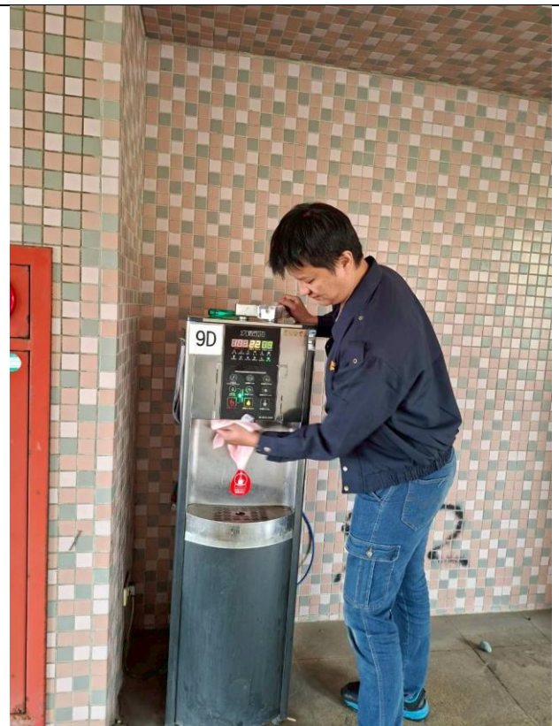
9 D : 中柱樓 9 樓