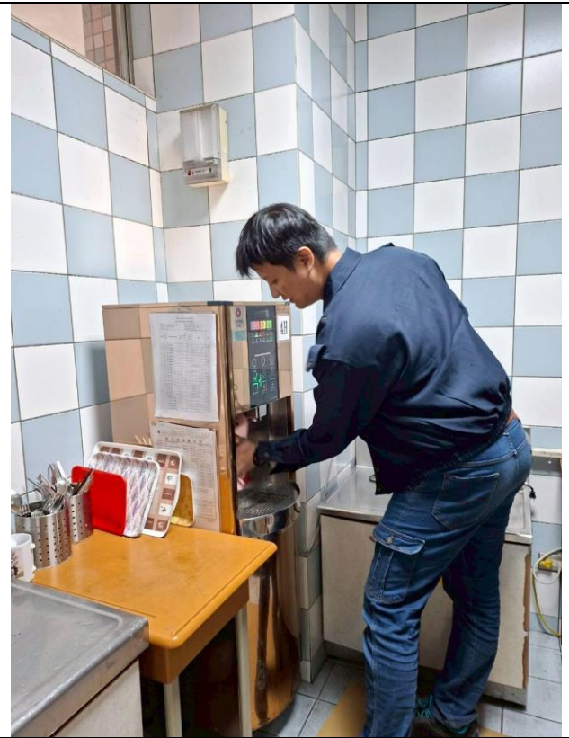
4 H : 4 樓秘書室