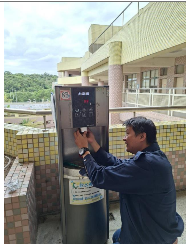
8 B：東風樓北側 8 樓