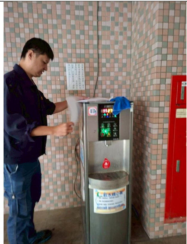
4D：中柱樓 4 樓