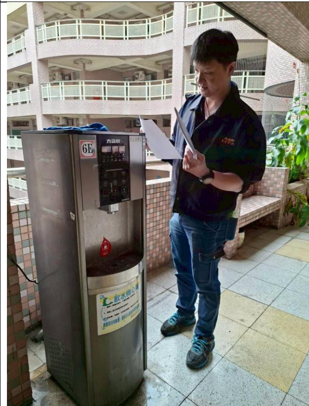
6E：中道樓 6 樓