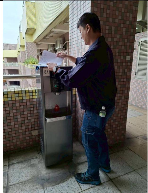
8A：東風樓南側 8 樓