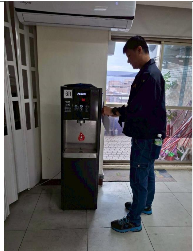
6H : 6 樓教務處