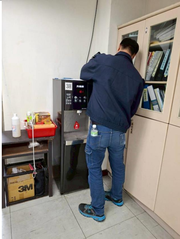
3H : 3 樓學務處