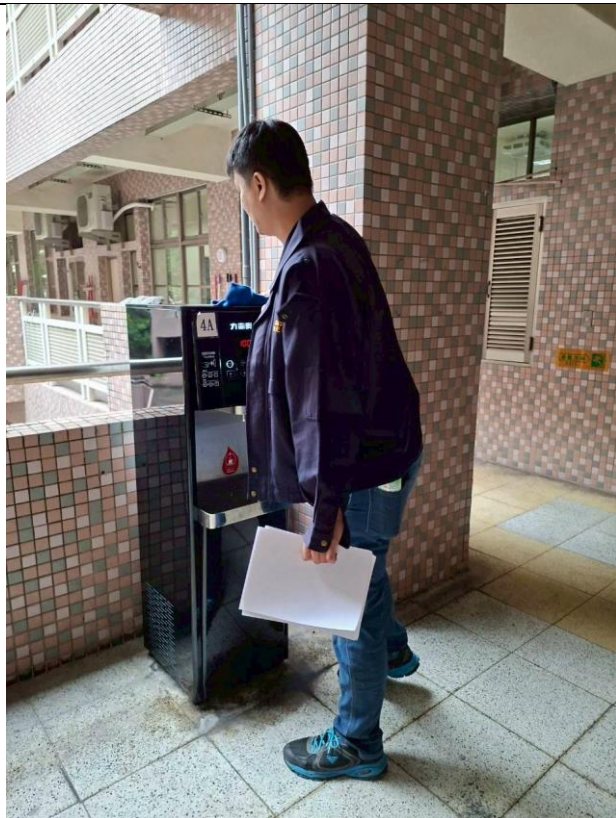
4A : 東風樓南側 4 樓