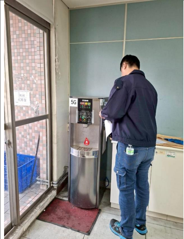
5G : 5 樓導師室