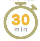
使用時間超過30分鐘 自動關火