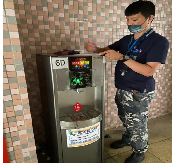
6D: 中柱樓 6樓