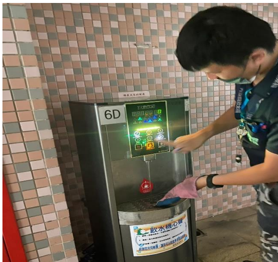
6D: 中柱樓 6樓