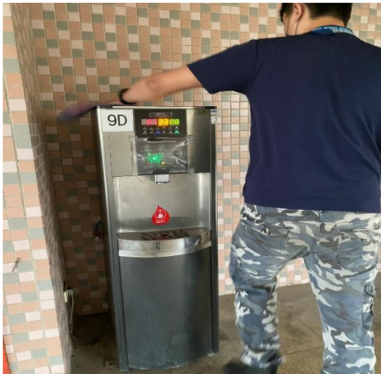
9D: 中柱樓 9樓