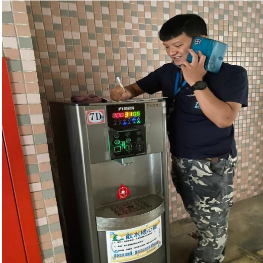
7D: 中柱樓 7樓