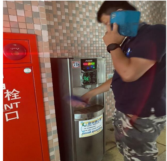
7D: 中柱樓 7樓