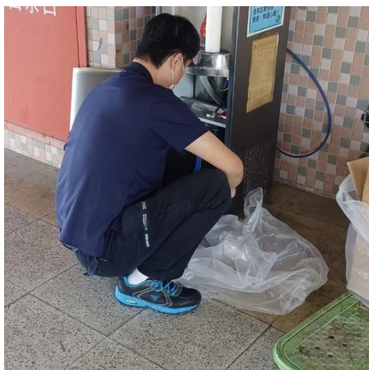
9D：中柱樓 9 樓