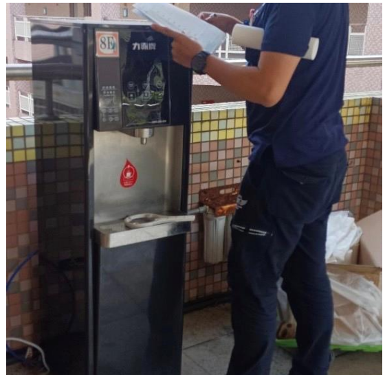
8E：中道樓 8 樓