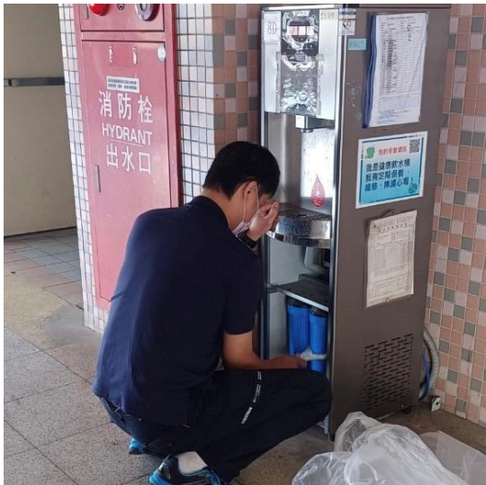
8D：中柱樓 8 樓