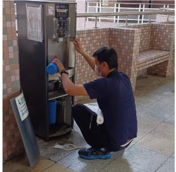
7E：中道樓 7 樓