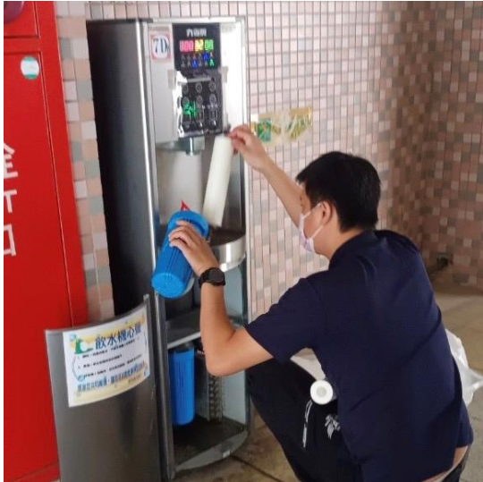
7D：中柱樓 7 樓