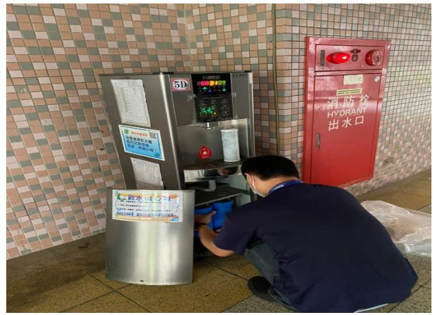
5D：中柱樓 5 樓