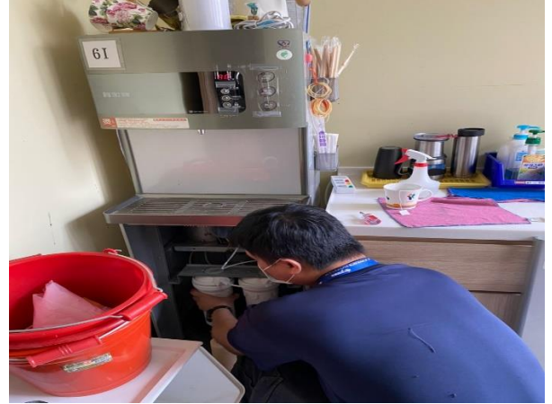
6I：圖書館 6 樓