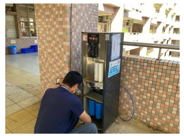
7E：中道樓 7 樓