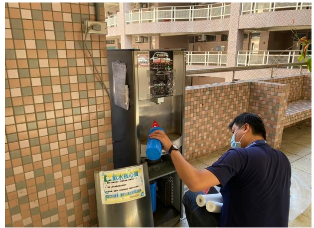
6E：中道樓 6 樓