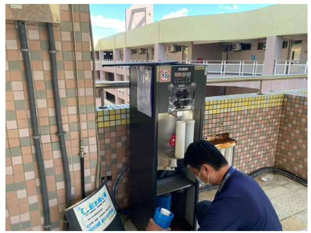
8E：中道樓 8 樓