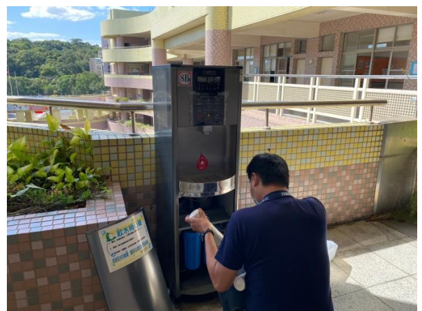
8B：東風樓北側 8 樓