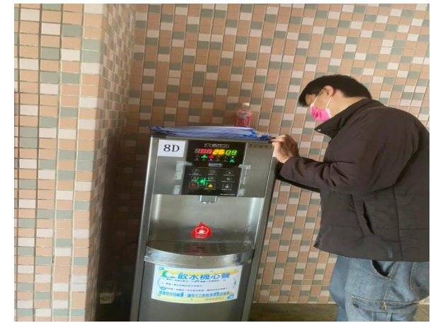
8D：中柱樓 8 樓