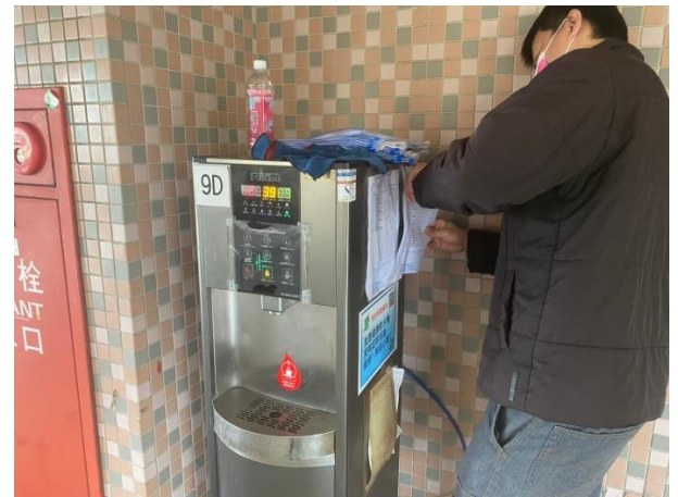
9D：中柱樓 9 樓