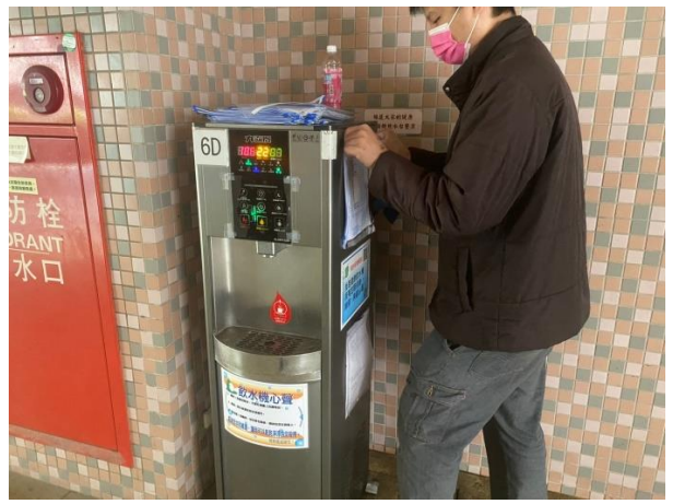
6D：中柱樓 6 樓