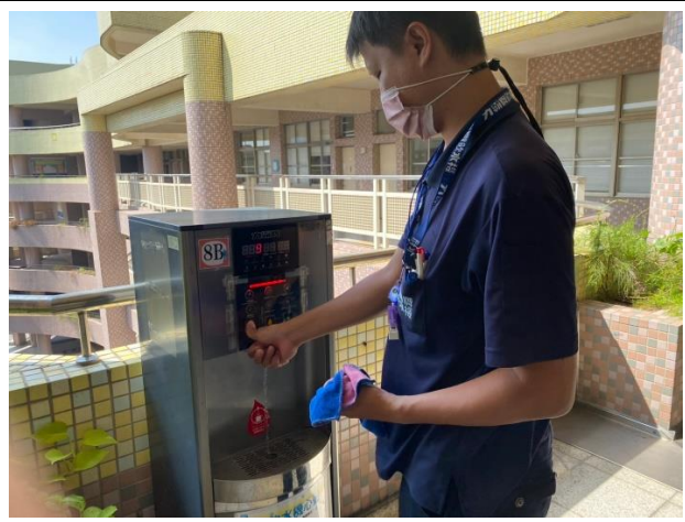
8B：東風樓北側 8 樓