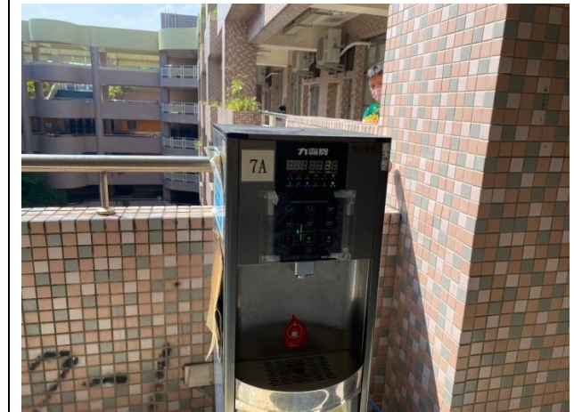
7A：東風樓南側 7 樓