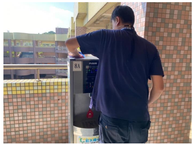
8A：東風樓南側 8 樓