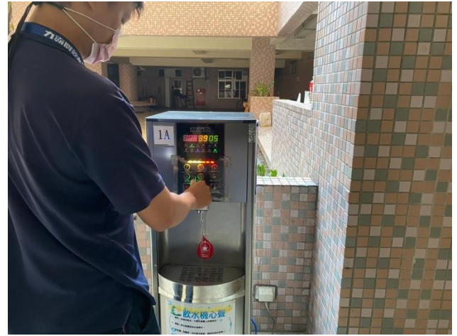
1A：東風樓南側 1 樓