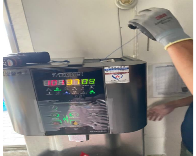
5G : 5樓導師辦公室