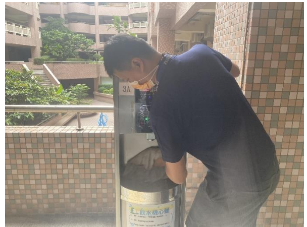
東風樓南側 3 樓