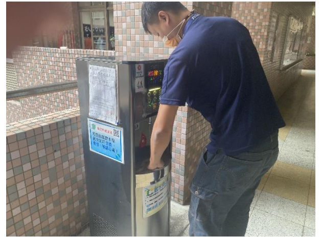
東風樓南側 4 樓