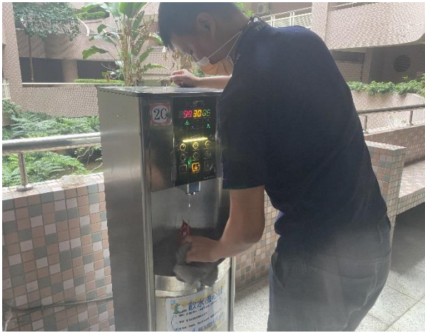
平山樓 2 樓