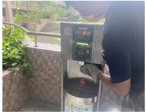
東風樓北側 3 樓