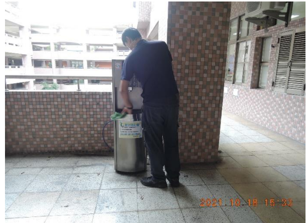
東風樓南側 6 樓