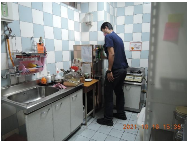
東風樓秘書室 4 樓