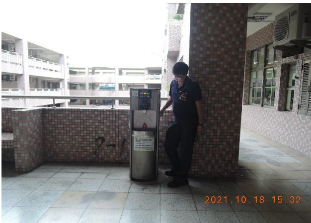
東風樓南側 7 樓