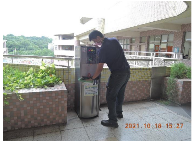
東風樓北側 8 樓