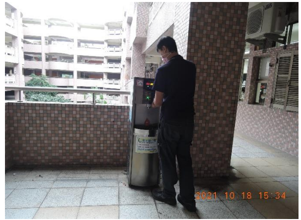
東風樓南側 5 樓